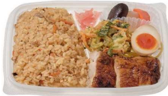
鶏めし御飯幕の内 590円