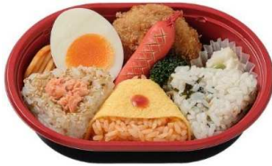
おにぎりランチ 390円