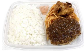
おかずが主役ハンバーグ & 唐揚げコンボ弁当 530円